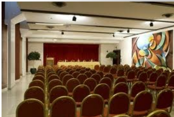
Sede del corso: Hotel dei Congressi, Roma